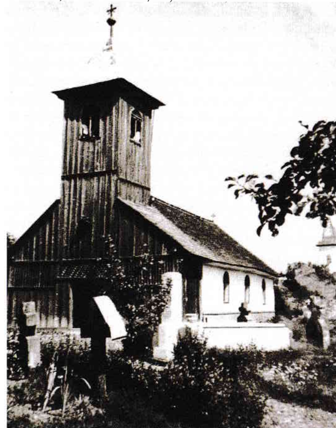
Fosta biserică greco-catolică din Sângeorz, devenită capelă mortuară

primesc bătaie pentru ceva, pentru orice, iar starea asta a durat până am ajuns la o vârstă mai „mare”, colo pe la vreo 16 ani, când bătaile s-au mai rărit. Primeam bătaie mai ales cu niște trandafiri de plastic, cu coadă din sârmă suficient de groasă, îmbrăcată în plastic verde, cu țepi artificiali. În rest, eram fata tatii și numai cu el aveam voie să-mi petrec timpul. Până odată, când m-a bătut cu atâta sânge, cu aceiași trandafiri din plastic, încât mi-a făcut răni pe spate. Mi le-a îngrijit Mama, plângând pe ascuns, în baie. Dar tot ea a și luat trandafirii și i-a dus în dar bisericii din centru, fostei „noastre” biserici, spunându-mi „Să facă bunul Dumnezeu ce-o vrea cu ei!”. Probabil că bunul Dumnezeu a acceptat suferința amândurora și a știut s-o schimbe în bine.