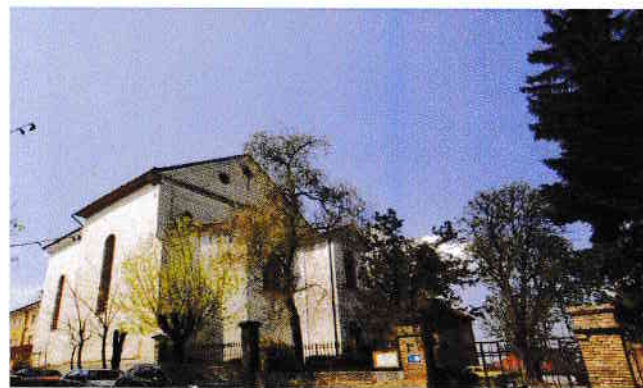
Biserica fraților minori de pe str. Köteles Sámuel